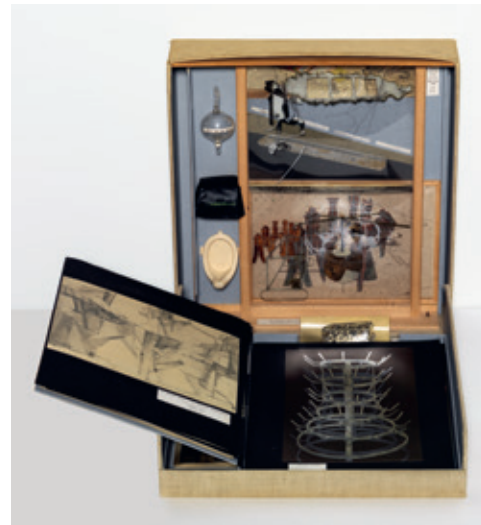
[Afb. 11] Marcel Duchamp (Blainville [FR] 1887 – Neuilly-sur-Seine [FR] 1968), Van of door Marcel Duchamp of Rose Sélavy (De doos in de vorm van een koffer) , [1958], kartonnen doos overtrokken met stof, met 68 voorwerpen, uit een reeks van 30 exemplaren, 9 × 37,7 × 40 cm. Aangekocht in 2000, inv. 12082.

Het legaat Goldschmidt-Safieva (zie pp. 74–75) zorgde in 1990 niet alleen voor een substantiële verrijking van de collectie werken op papier van Belgische en buitenlandse kunstenaars, maar gaf ook een nieuw elan aan de aankooppolitiek waarvan de dynamiek in de jaren 1970 sterk verminderd was. De collectie werken op papier werd verrijkt met kunst van onder meer Gaston Bertrand, Marc Chagall, Roel D'Haese, Eugène Dodeigne, Hans Hartung, David Hockney (afb. 10), Paul Klee, Louis Van Lint, Pablo Picasso (afb. p. 75), Marc Tobey, Cy Twombly en Ossip Zadkine.