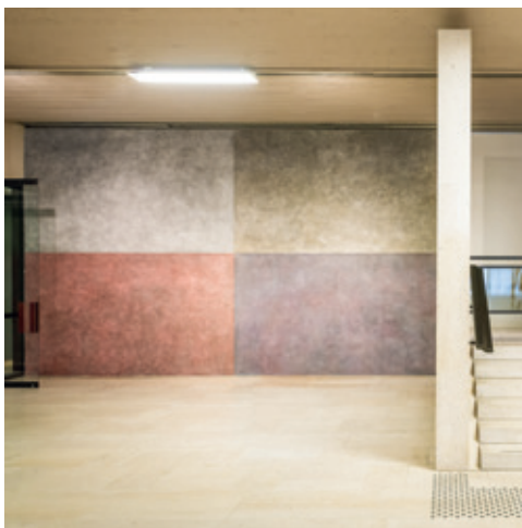
[Afb. 7] Sol LeWitt (Hartford [US] 1928 – New York [US] 2007), Wall Drawing nr. 426 [1985], gewassen tekening op de muur, 385 × 618,5 cm. Aangekocht in 1985 en gerealiseerd in situ in 1986, inv. 10537.

daarop organiseerden de KMSKB de tentoonstelling ‘Kunst in België na 1980’ met werk van een dertigtal kunstenaars. Aan de andere kant van de Kunstberg, in het voormalige warenhuis Old England, hadden tussen 1993 en 1995 drie tentoonstellingen met eigentijdse kunst plaats (‘Le Jardin de la Vierge’, ‘Toscani al muro’ en ‘Les Fragments du désir’). Deze periode culmineerde in de opening van twee nieuwe instellingen voor hedendaagse kunst: in 1999 het SMAK in Gent en in 2002 het MACS in Le Grand Hornu.