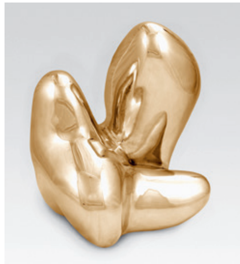
[Afb. 5] Hans Arp (Straatsburg [FR] 1886 – Locarno [IT] 1966), Mirr , [1936], verguld brons, 38,5 × 32 × 34 cm. Gekocht van de kunstenaar op de tentoonstelling '50 jaar moderne kunst', 1958, inv. 6815.