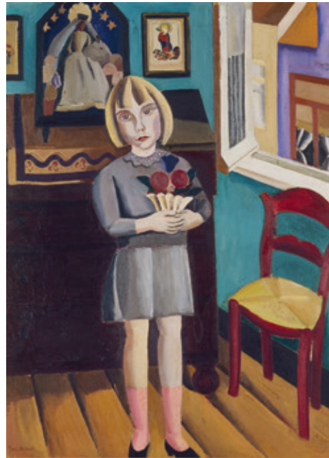
[Afb. 3] Gustave De Smet (Gent [BE] 1877 – Deurle [BE] 1943), Beatrijs , [1923], olieverf op doek, 140 × 100 cm. Geschonken door het Comité Fierens-Gevaert, 1927, inv. 4678.

Worden de expressionistische en vooral de surrealistische ensembles van de collectie vandaag als de rijkste beschouwd, dan is dat te danken aan het feit dat zij als entiteit getuigen van het artistieke, culturele en maatschappelijke netwerk dat aan de basis van deze kunststromingen lag. De samenstelling van deze ensembles is coherent en veelzijdig en de kunstwerken hebben vaak een gelijklopend tentoonstellingsparcours gemeen of vormen het onderwerp van eigentijdse publi-