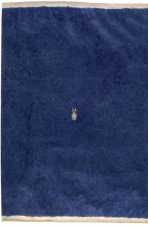
[Afb. 12] Jan Fabre (Antwerpen [BE] 1958), Zonder titel , 1989, blauwe bic, wandelend blad op geprepareerd papier, 219,5 × 151,5 cm. Aangekocht in 1991, inv. 11312.