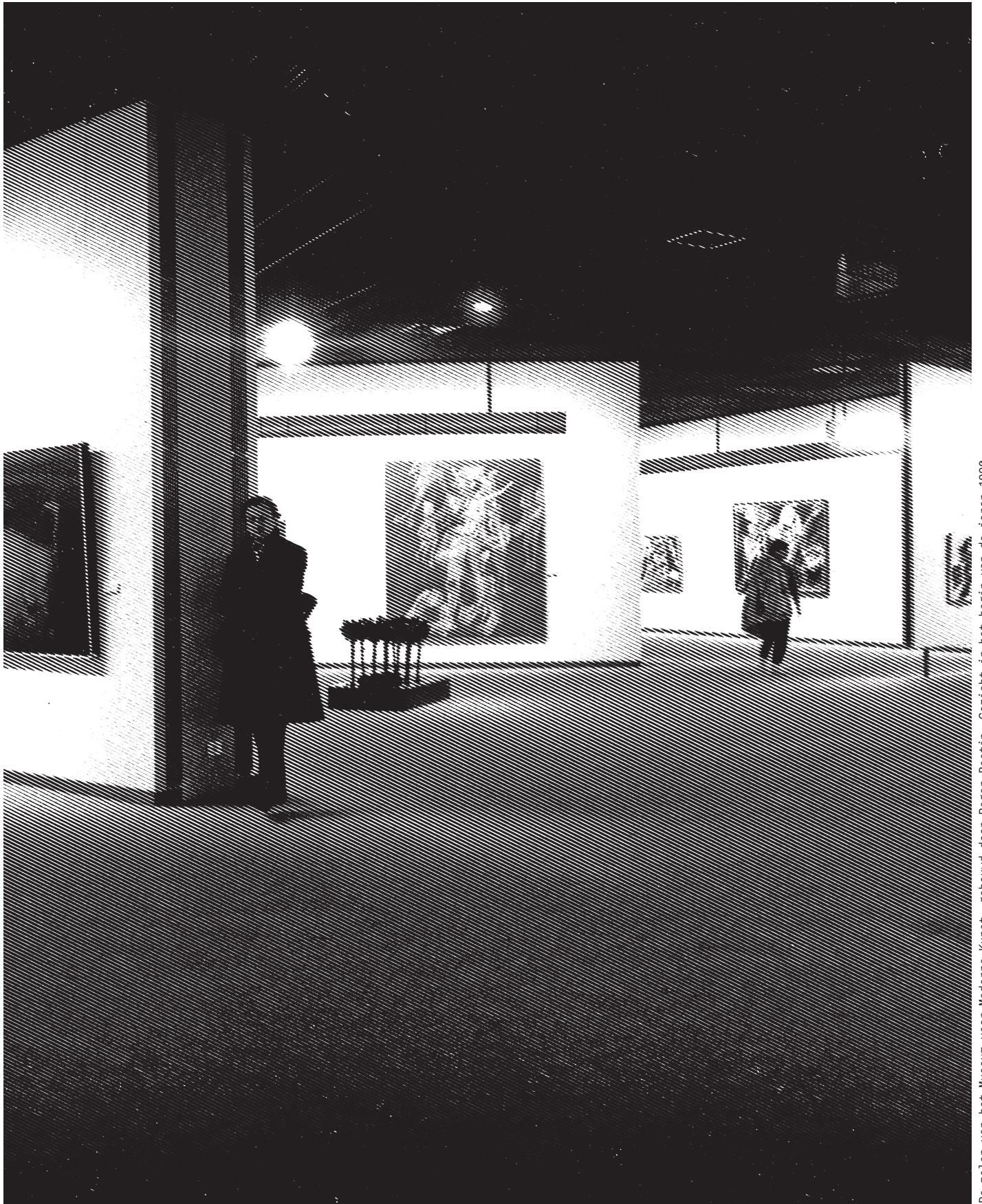
De zalen van het Museum voor Moderne Kunst, gebouwd door Roger Bastin. Gezicht in het begin van de jaren 1980.