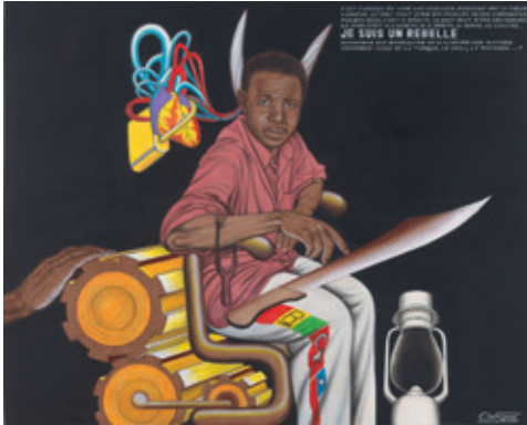
[Afb. 9] Chéri Samba (Kinto M'Vuila [CD] 1956), Ik ben een rebel , 1999, acrylverf op doek, 81 × 100 cm. Aangekocht in 2020, inv. 12602.