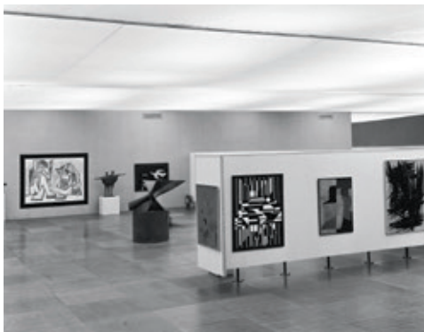
[Afb. 4] De tentoonstelling '50 jaar moderne kunst' tijdens Expo 58 in Brussel. De werken van Kenneth Armitage, Victor Vasarely en Serge Poliakoff werden aangekocht door de KMSKB.

Vanaf 1948 ontwikkelde zich onder impuls van dichter Christian Dotremont een dynamische vleugel van de CoBrA-groep in Brussel. Toch bekleedt de schilder- en beeldhouwkunst van de eerste naoorlogse Europese avant-garde een bescheiden plaats in