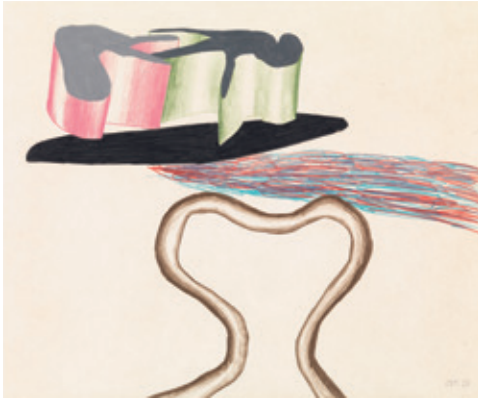
[Afb. 10] David Hockney (Bradford [GB] 1937), American Landscape Pie , 1965, vetkrijt op papier, 35,5 × 42,8 cm. Legaat Alla Goldschmidt-Safieva, inv. 11182.

organisatie van het museum, hoewel ze aanvankelijk om praktische redenen samengevoegd werd met die van de beelden. Het systeem van aanwinsten werd toen echter nog steeds (sinds 1933) door drie aparte commissies beheerd: oude kunst, moderne kunst en beeldhouwwerk. De aankoop van werken op papier viel aanvankelijk onder de aankoopcommissie voor schilderkunst, maar speelde amper een rol in het aankoopbeleid. Dat veranderde in 1979 met de oprichting van een nieuwe commissie verantwoordelijk voor de aankopen op het vlak van beeldhouwkunst, tekeningen, moderne affiches en ook fotografie. Deze trage evolutie was te wijten aan de geringe belangstelling van de Belgische musea en het publiek voor werken op papier, enkele internationale grote namen uitgezonderd.