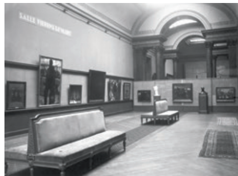
[Afb. 1] De zaal Fierens-Gevaert met moderne kunst in 1927.

De opening in 1984 van het lang verwachte Museum voor Moderne Kunst onder impuls van hoofdconservator Philippe Roberts-Jones en ontworpen door architect Roger Bastin, vormt een mijlpaal in de geschiedenis van de