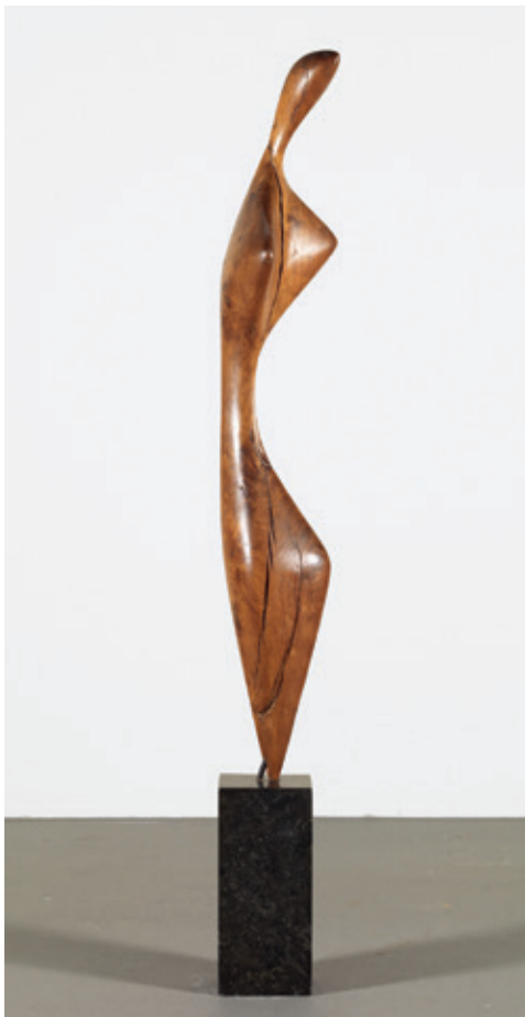
[Afb. 2] Eugène Dodeigne (Rouvreux [BE] 1923 – Bondues [FR] 2015), Vrouw , [1952], hout, 145 x 22 x 23 cm. Legaat Alla Goldschmidt-Safieva, Brussel, 1990, inv. 11238.

verzameling en stimuleerde de belangstelling bij zowel het grote publiek als de verzamelaars. Niet toevallig werd in de daaropvolgende jaren de collectie verrijkt met twee spectaculaire legaten. In 1996 schonk Irène Scutenaire-Hamoir een indrukwekkende verzameling surrealistische kunst, bestaande uit 254 schilderijen, sculpturen, objecten en werken op papier, waarvan 101 gesigneerd door of toegeschreven aan René Magritte. Niet minder impressionant was de generositeit van Alla Goldschmidt-Safieva. Zij legateerde in 1990 de integrale verzameling die haar echtgenoot Bénédict vooral na de Tweede Wereldoorlog