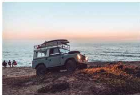
TouchRetouch – Nu zie je ze...

3 Begin als eerste met Afstellen en zet Sfeer op zo'n 30% om het beeld levendiger te maken. Kies daarna de tool Selectief voor punten binnen het beeld die je wilt ophogen. Meestal werk ik met het licht dat al in het beeld aanwezig is. Daardoor maak ik alleen de accenten lichter en de schaduwen donkerder, en haal ik het onderwerp van de foto naar voren.