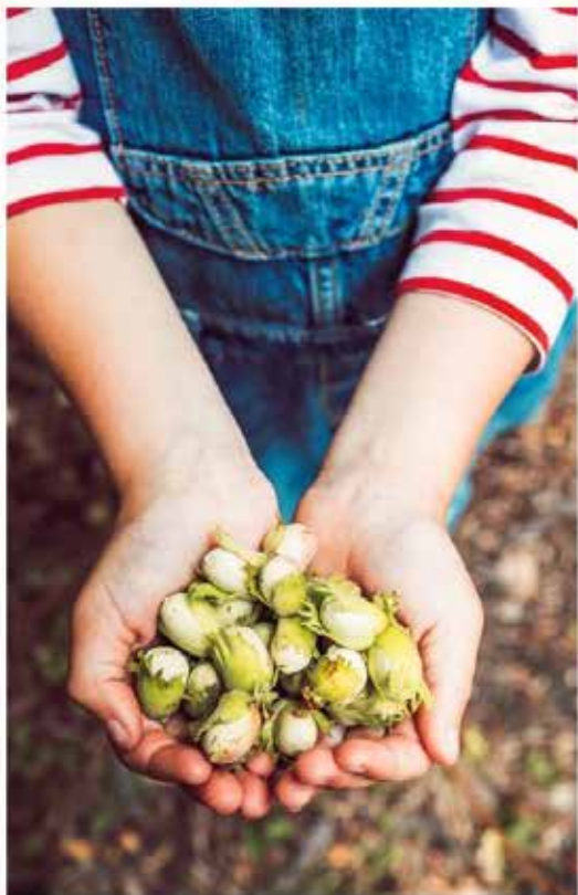
Gefotografeerd voor Fleurst door Sian Tucker. Gepubliceerd door Kyle Books.