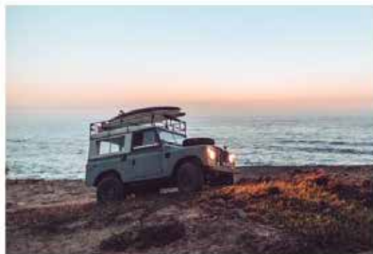
Nu niet meer!