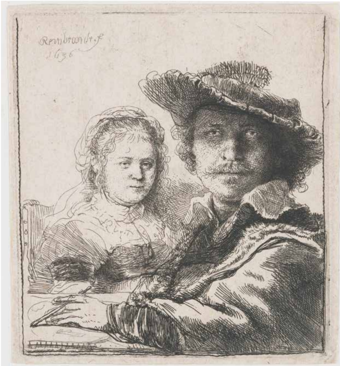
Zelfportret met Saskia, Rembrandt van Rijn, 1636