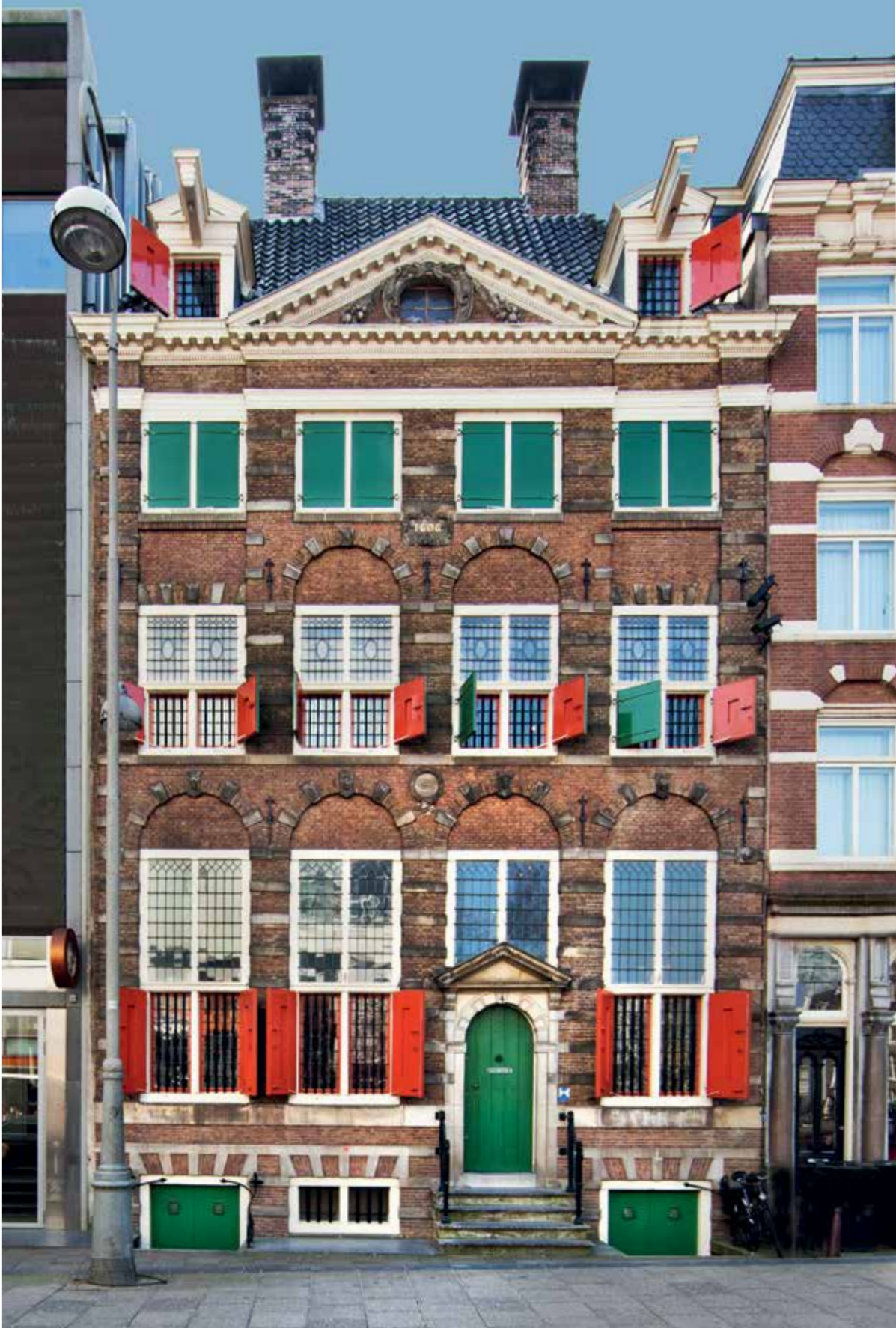
Het woonhuis van Rembrandt in de Sint Antoniesbreestraat, nu Museum Het Rembrandthuis (Jodenbreestraat)