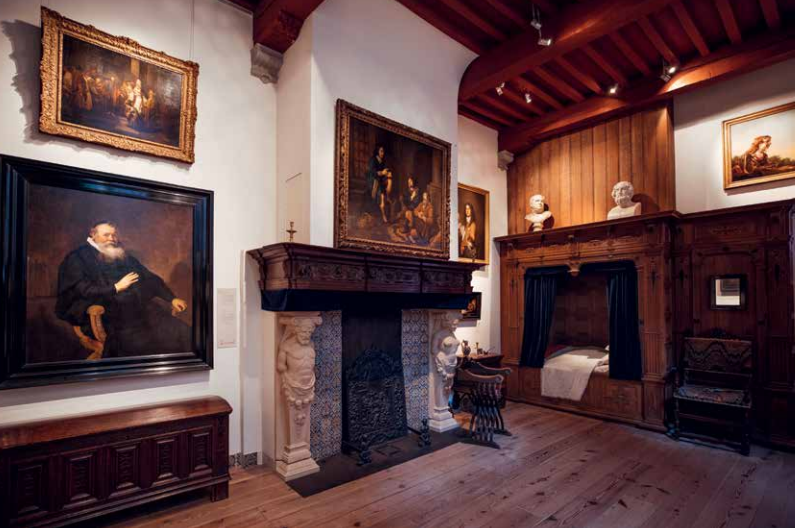
De Sael in Het Rembrandthuis. Dit was de woonruimte van Rembrandt en Saskia

Het is levendig in huize Rembrandt, met een komen en gaan van leerlingen, klanten en kunstverzamelaars. In het voorhuis van de statige woning ontvangt Rembrandt opdrachtgevers en goede vrienden uit de hoogste kringen. De ruimte erachter is de plek waar de familie woont. Het is een hoge, ruime kamer met een grote schouw en een bedstede die te zien is op een aantal van Rembrandts kunstwerken. Op de eerste verdieping richt Rembrandt een van de kamers in als kunstkamer, de plek waar hij het resultaat van zijn verzamelwoede bewaart en uitstalt. Ernaast, in de grootste ruimte van het huis, is zijn atelier gevestigd. Hier schildert hij zelf en begeleidt hij vier tot vijf leerling-schilders. Het is de perfecte plek, want dit is niet alleen de grootste ruimte van het