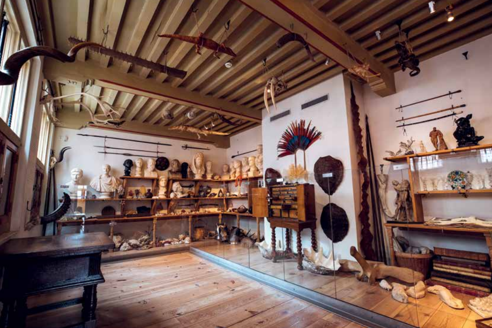
De kunstkamer in Het Rembrandthuis, waar Rembrandt zijn verzamelingen bewaarde en tentoonstelde

den; hij begint in zijn nieuwe, veel soberder huis weer meteen aan een nieuwe collectie.