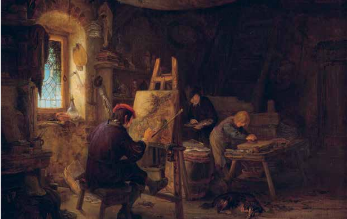
Schildersatelier , Adriaen van Ostade, ca. 1647-1650

Amsterdam. Hij is nog geen twintig als hij voor zichzelf begint. Zijn vroegst gedateerde schilderij, De steniging van de Heilige Stefanus , is van 1625. In de drie jaar die volgen, groeit zijn bekendheid zodanig dat hij in 1628 zijn eerste leerling kan aannemen, Gerard Dou.