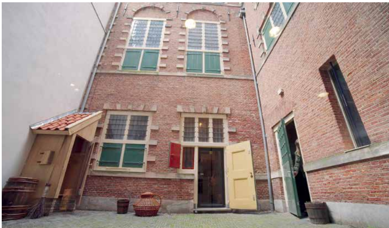
Binnenplaats van Het Rembrandthuis. Hier werkte Rembrandt mogelijk aan zijn Nachtwacht

kia en Rembrandt geboren: Titus. Hij is het enige kind dat overleeft en hij zal uiteindelijk in 1668 overlijden, een jaar voordat Rembrandt zelf sterft. Het geluk van een gezonde zoon wordt overschaduwd door de ziekte van Saskia. Ze brengt veel tijd in bed door. In de zomer van 1642 overlijdt Saskia, vlak voor haar dertigste verjaardag.