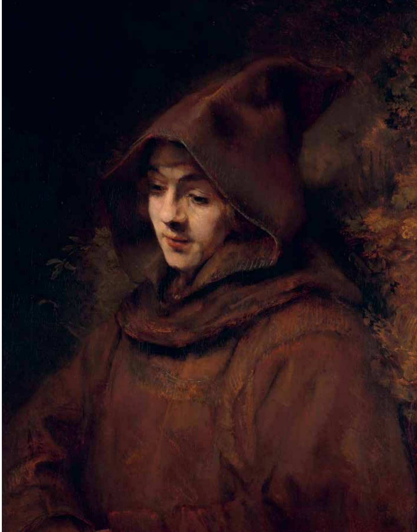
Rembrandts zoon Titus in monniksdracht , Rembrandt van Rijn, 1660