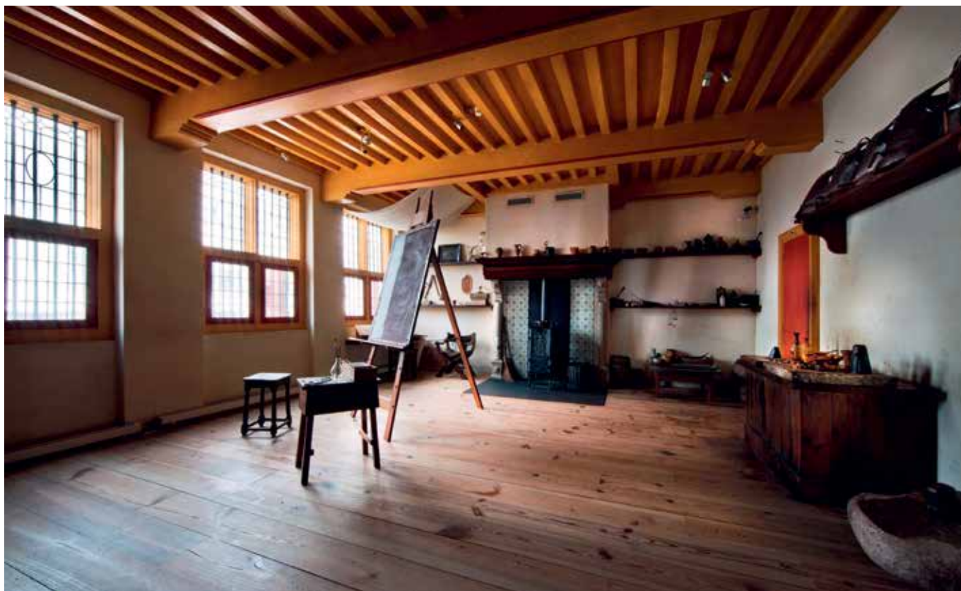
Het schildersatelier van Rembrandt in Het Rembrandthuis