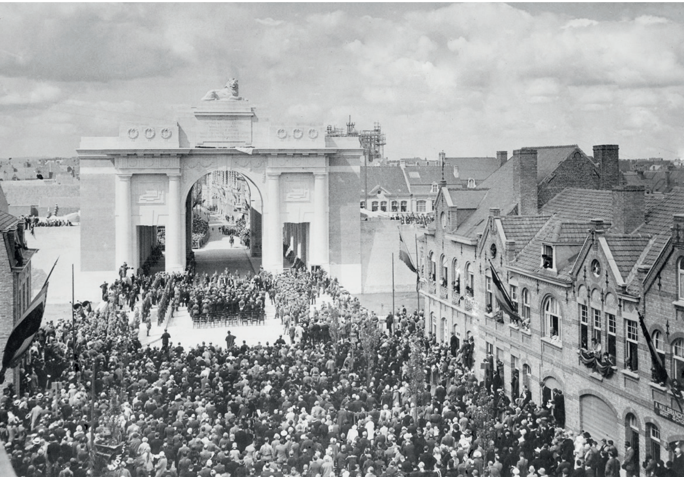
Foto: Op de Frenchlaan verdringt zich een massa tijdens de inhuldiging van het Menenpoort Memoriaal voor de Vermisten op 24 juli 1927.