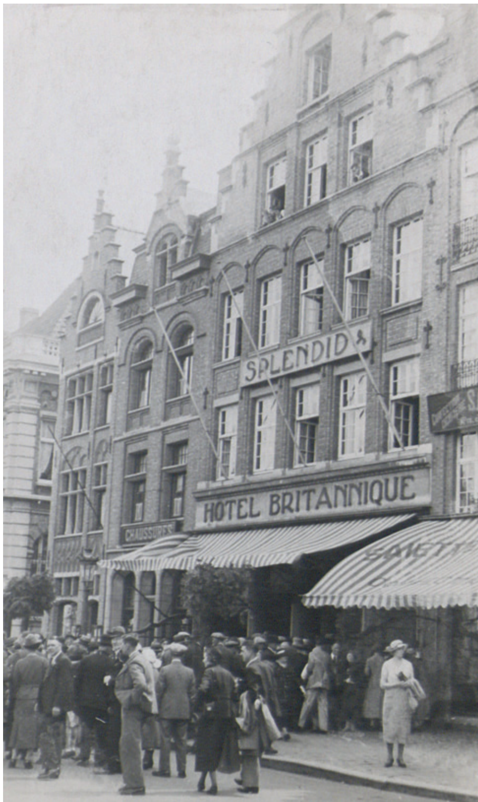
Foto: Het Hôtel Britannique, circa 1935. Hier werd voor het eerst het idee van een Last Post Ceremonie besproken.