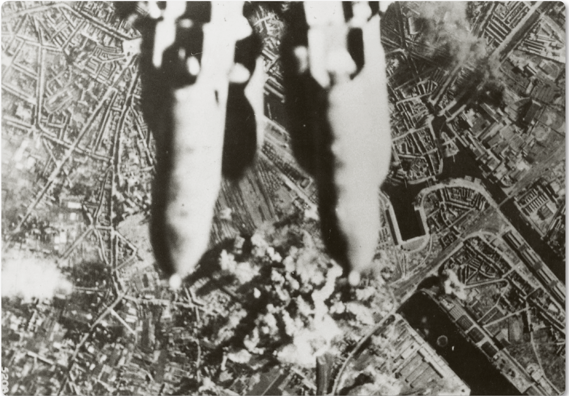
I.16 Op 22 juni 1944 voerde de 1st Bomb Division een aanval uit op het rangeerterrein en het station van Gent-Zeehaven. Tijdens het bombardement, dat begon rond 18.00 uur, dropten de 69 Amerikaanse bommenwerpers ruim 205 ton bommen. Aan boord van een van de B 17's maakte men foto's om het resultaat na afloop te evalueren. Het centrum van het bommentapijt lag weliswaar rondom het station, maar op deze foto is duidelijk te zien dat ook de omgeving zwaar werd getroffen.