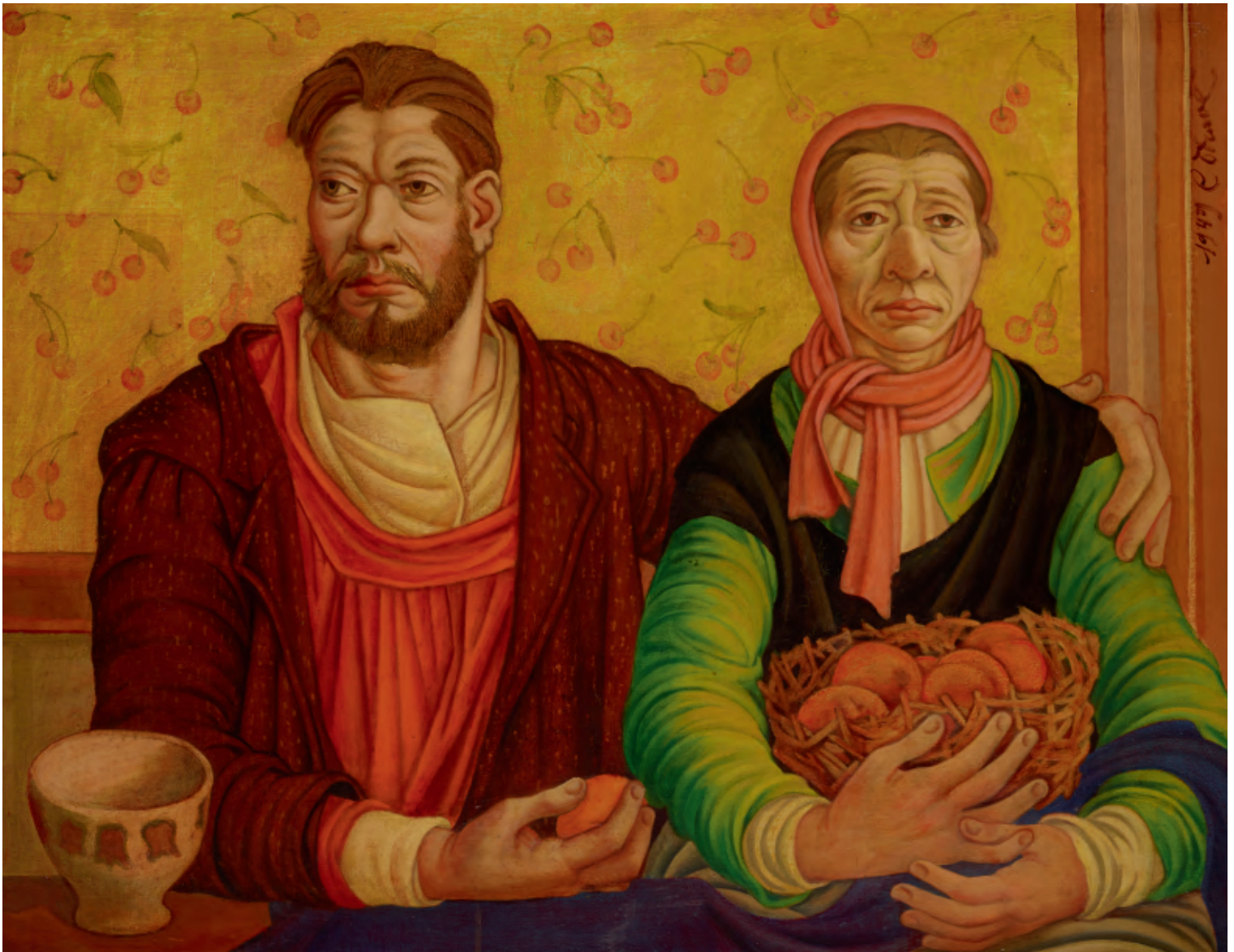
Zelfportret met moeder – 1949, olie op doek, 70 x 90 cm, privébezit