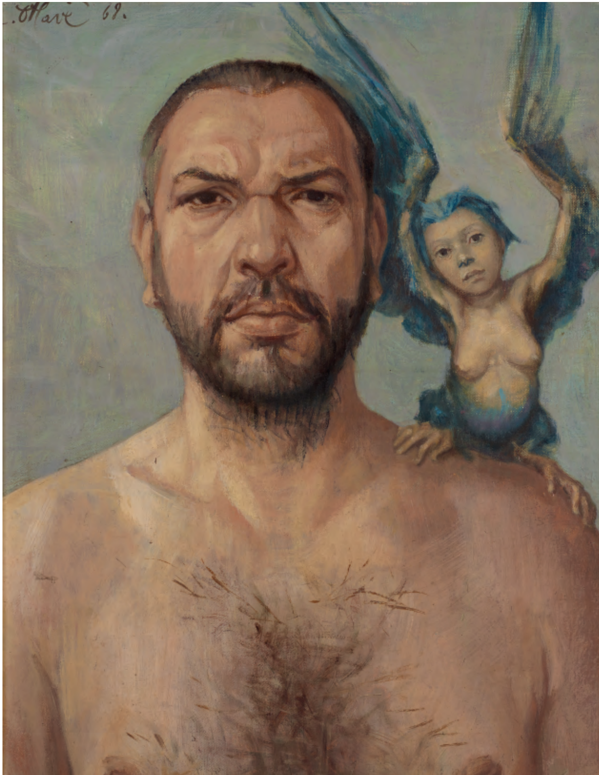
De muze – 1968, olie op doek, 50 x 40 cm, privébezit