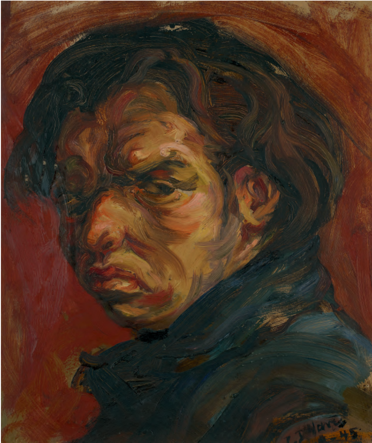
Portret – 1945, olie op papier, 35 x 29 cm, privébezit