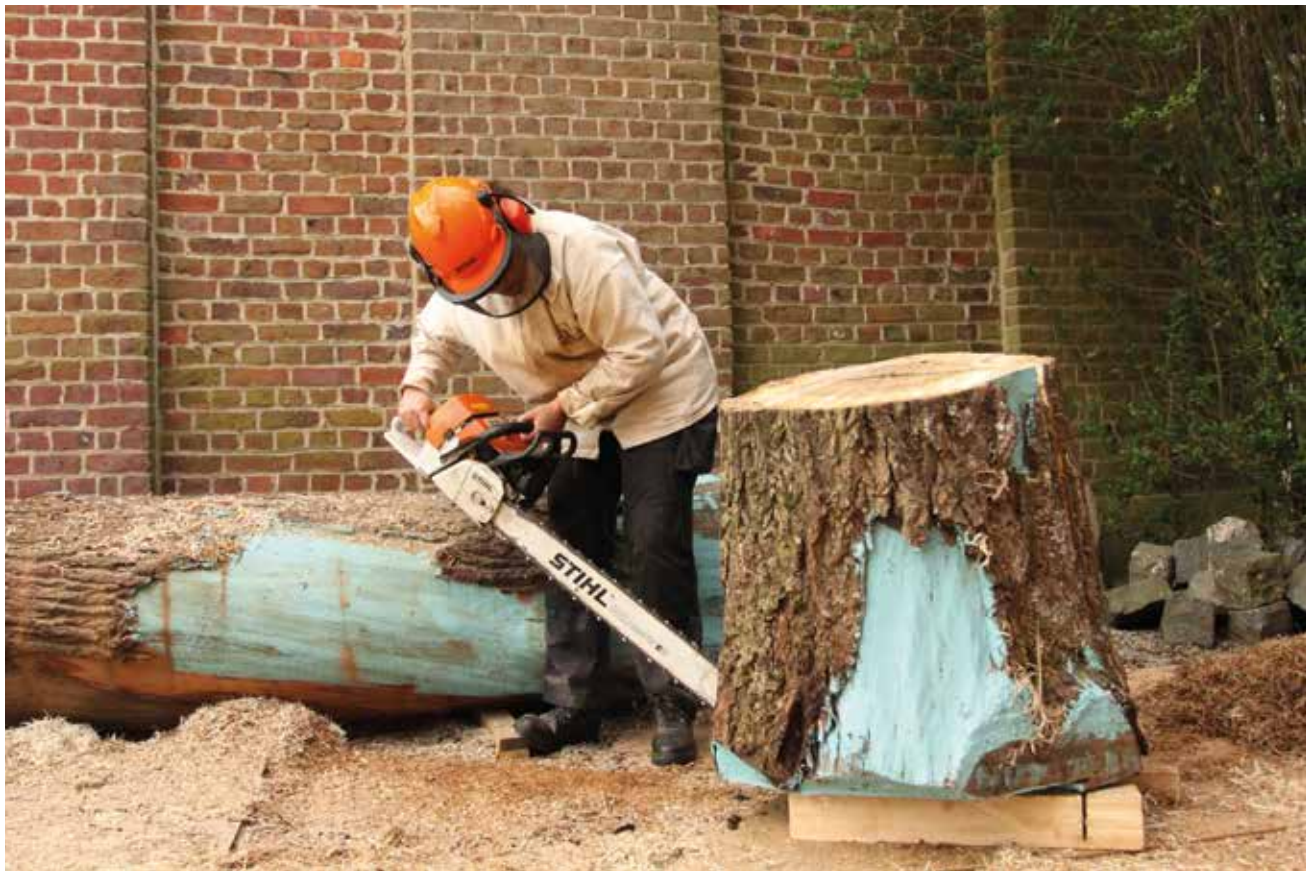
Van boven naar beneden From top to bottom Philippe Allaey – Z-editions, p. 74 MdSt – Bosq, p. 140