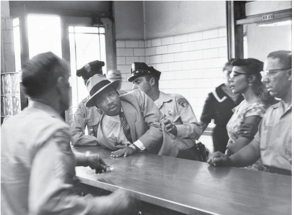
Montgomery, Alabama, 1958. Martin Luther King jr. wordt gearresteerd voor 'rondhangen in de buurt van een rechtszaal'. Zijn vrouw Coretta kijkt toe.