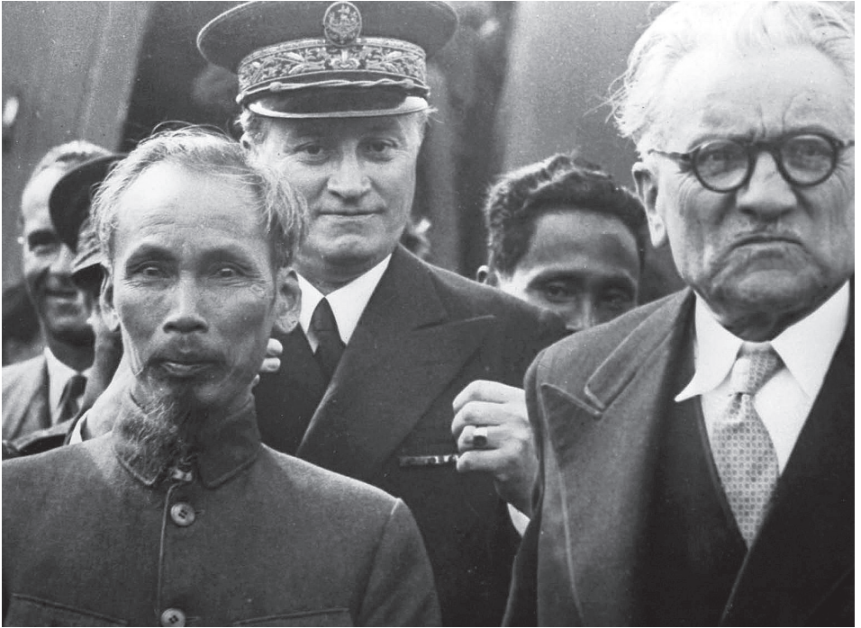
Ho Chi Minh, november 1950. Tijdens de late jaren veertig en de vroege jaren vijftig had Ho de leiding over de militaire operaties tegen de Franse bezetter in Vietnam.