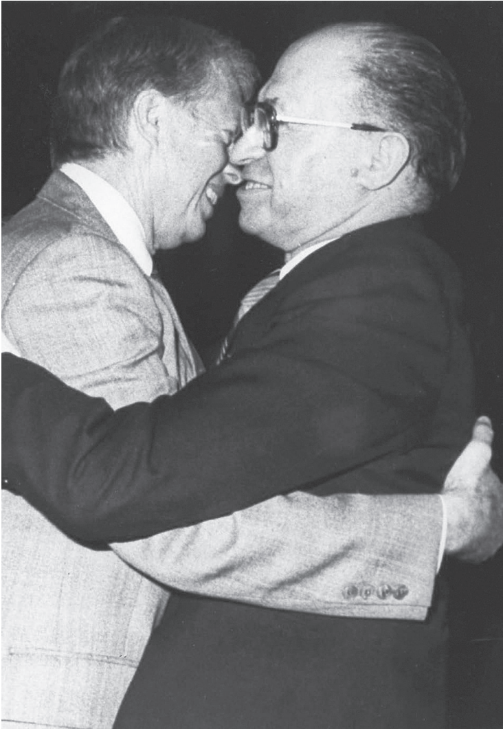
Maart 1979. President Jimmy Carter van de Verenigde Staten (links) en premier Menachem Begin van Israël ontmoeten elkaar in Tel Aviv, bij het begin van vredesbesprekingen tussen Israël en Egypte.