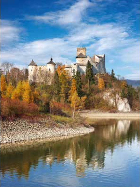
Het kasteel Niedzica in het Nationaal Park van de Pieniny