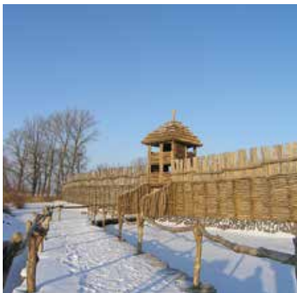
Reconstructie van de prehistorische stad van Biskupin

Tip: u kunt terugkeren naar Wrocław of doorrijden naar Warschau ( blz. 126 ) en een bezoek brengen aan de hoofdstad van het land.