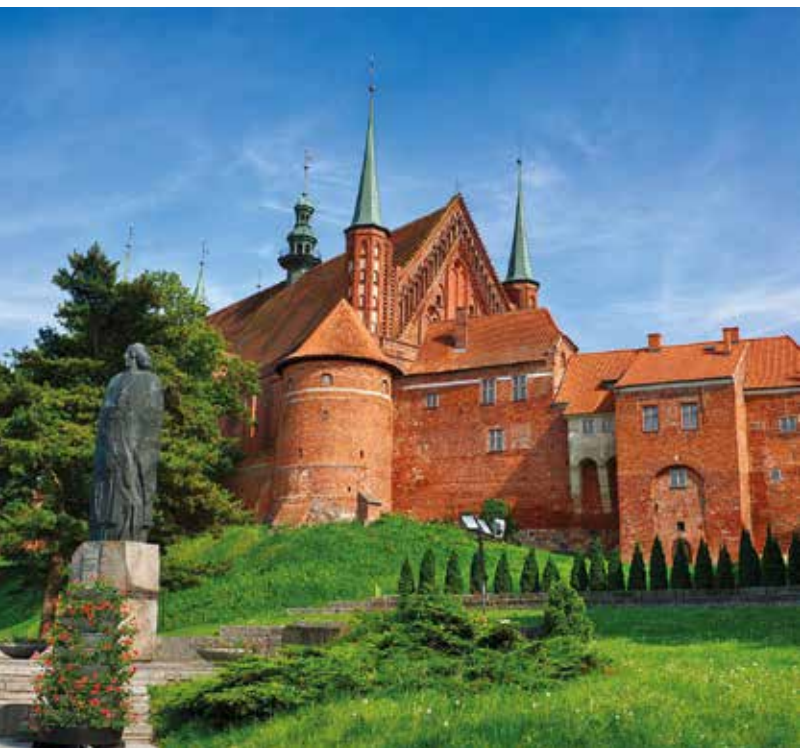
De kathedraal van Frombork en het standbeeld van Copernicus