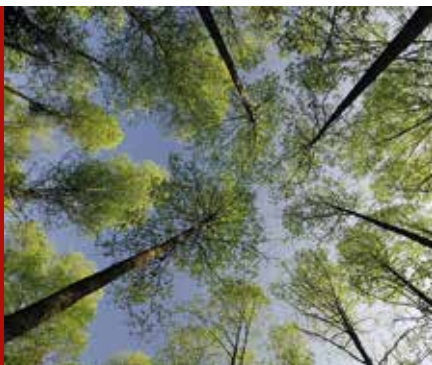
In het oerbos van Białowieża

♥ Wandel door Mariensztat , een vredig wijkje in de Poolse hoofdstad, gelegen op de oevers van de Wisła, waar de tijd lijkt te hebben stilgestaan. Zie blz. 146.