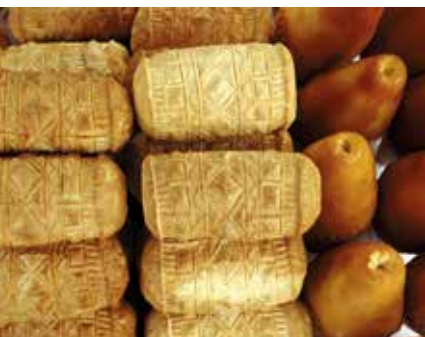
De oscypek, specialiteit van Zakopane

in het Shakespearetheater in Gdańsk. Het is het enige Elizabethaanse theater buiten Groot-Brittannië. De sfeer is nog steeds dezelfde als in de 16de eeuw, maar er is tegenwoordig wel meer comfort. Zie blz. 499.