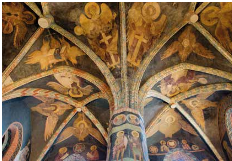
De Russisch-Byzantijnse fresco's in de Kapel van de Heilige Drie-eenheid in Lublin

♥ Bewonder de middeleeuwse fresco's waarmee de muren van de Kapel van de Heilige Drie-eenheid in het kasteel van Lublin zijn bedekt. Zie blz. 197.