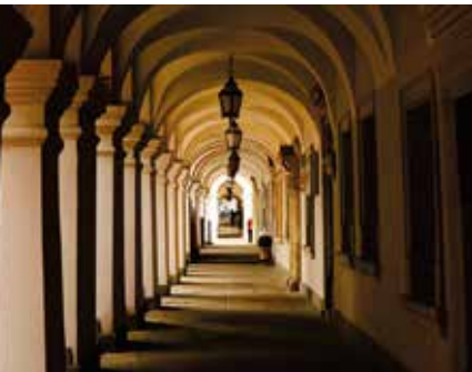
Onder de arcades van de Rynek van Zamość

Bezoek vooral het Museum van Warschau ( blz. 135 ), het Museum van de Geschiedenis van de Poolse Joden POLIN ( blz. 151 ) en het Paleis van Cultuur en Wetenschappen ( blz. 147 ), en slenter langs de boulevards van de Wisła ( blz. 145 ).