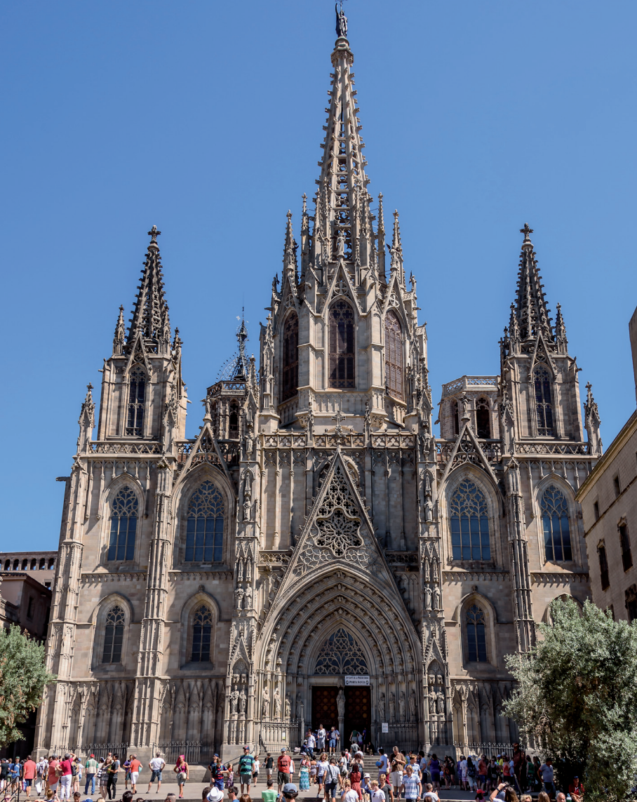
De gotische Catedral Santa Eulàlia is de belangrijkste kerk van het aartsbisdom Barcelona.