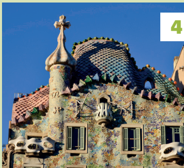
Casa Batlló ★★★ Vouwkaart C3 - 📍 blz. 67