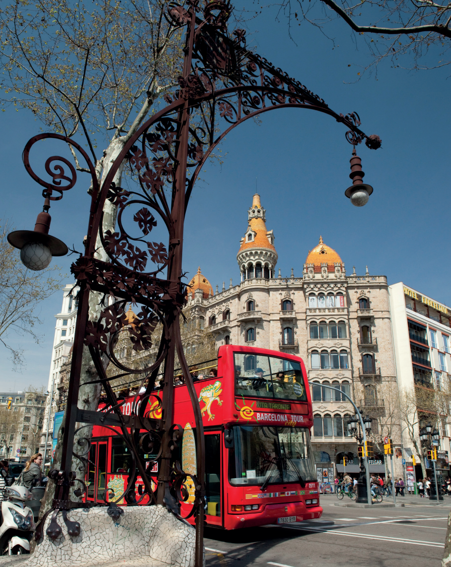
De beroemde straatlantaarns aan de Passeig de Gràcia