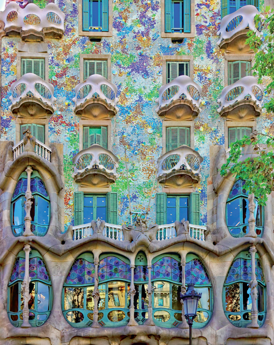
La Ruta del Modernisme leidet u langs de modernistische monumenten en musea van Barcelona. Zo bewondert u onder meer de gevel van Casa Batlló.