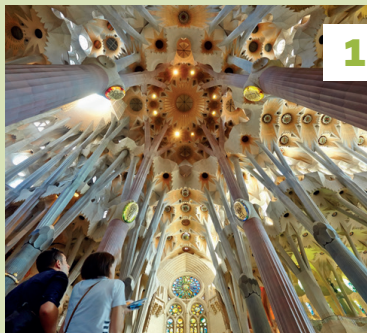
Sagrada Família ★★★ Vouwkaart D1 - 📍 blz. 70