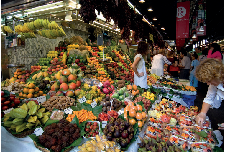
La Boqueria, een traditionele markt met typische, Catalaanse producten

Gezellige bars liggen zij aan zij met chique winkels en middeleeuwse panden.