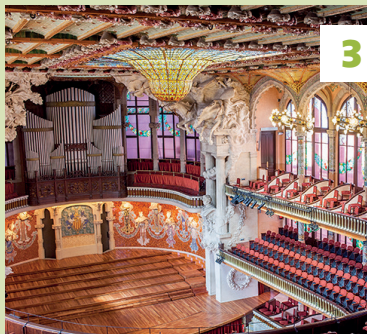
Palau de la Música Catalana ★★★ Vouwkaart E4 - 📍 blz. 44