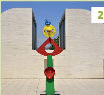
Montjuïc ★ en zijn musea: MNAC ★★★ en Fundació Miró ★★★ Vouwkaart A7-D8 - 📍 blz. 96 en 102