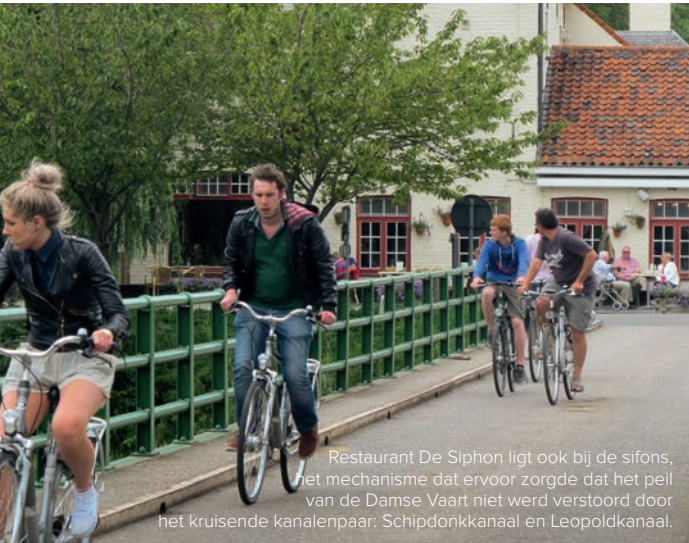
Restaurant De Siphon ligt ook bij de sifons, het mechanisme dat ervoor zorgde dat het peil van de Damse Vaart niet werd verstoord door het kruisende kanalenpaar: Schipdonkkanaal en Leopoldkanaal.

'Al ons hele leven trekken we naar De Siphon voor een heerlijke palingbereiding. Vroeger gingen we er op Kerstdag steevast met de grootouders naartoe. Dit is meer dan een gevestigde waarde, dus.'