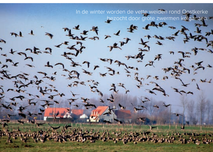
In de winter worden de vette weiden rond Oostkerke bezocht door grote zwermen kolganzen.