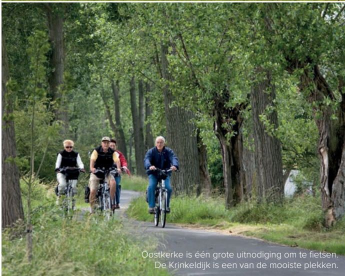
Oostkerke is één grote uitnodiging om te fietsen. De Krinkeldijk is een van de mooiste plekken.