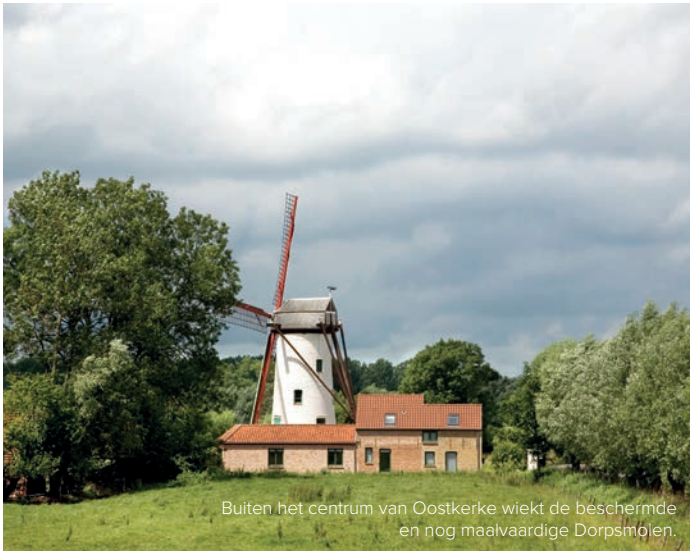
Buiten het centrum van Oostkerke wiekt de beschermde en nog maalvaardige Dorpsmolen.