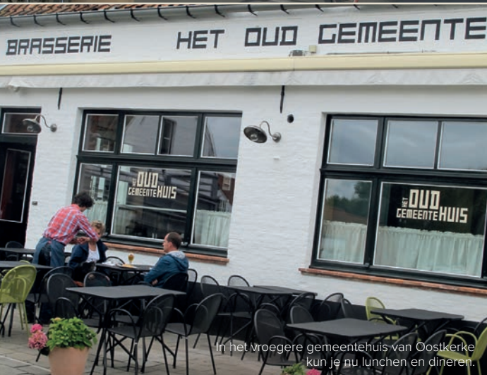
In het vroegere gemeentehuis van Oostkerke kun je nu lunchen en dineren.