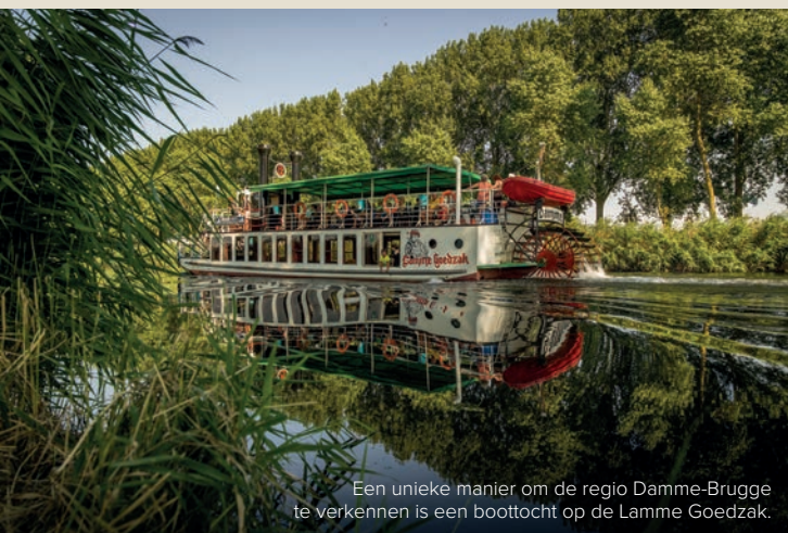
Een unieke manier om de regio Damme-Brugge te verkennen is een boottocht op de Lamme Goedzak.

Vanaf april tot eind september doet de Lamme Goedzak, de enige West-Vlaamse raderboot met Mississipi-allures, vijf keer per dag zijn trage ding. Inschepen voor deze unieke boottocht doe je in Damme of in Brugge. Zelfs je fiets kan mee.