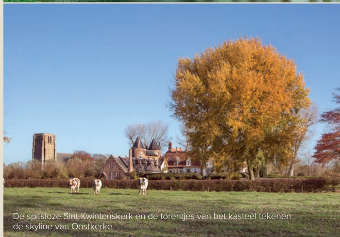
De spitsloze Sint-Kwintenskerk en de torentjes van het kasteel tekenen de skyline van Oostkerke.