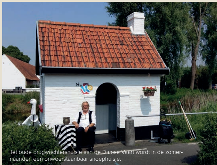
Het oude brugwachtershuisje aan de Damse Vaart wordt in de zomermaanden een onweerstaanbaar snoephuisje.

Wie het wat verder zoekt, belandt in Hofstede De Stamper, een fotogenieke 17de-eeuwse boerderij die grossiert in authenticiteit. Op het menu: bourgondische gerechten met 'vlees van eigen kweek' en hoeveproducten.