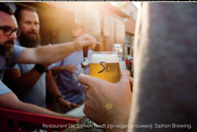
Restaurant De Siphon heeft zijn eigen brouwerij: Siphon Brewing.