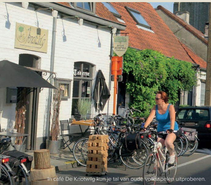
In café De Knotwilg kun je tal van oude volksspelen uitproberen.