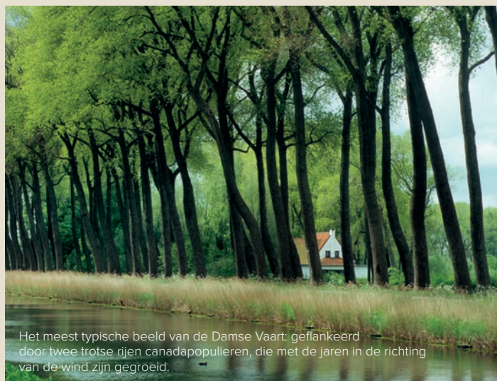
Het meest typische beeld van de Damse Vaart: geflankeerd door twee trotse rijen canadapopulieren, die met de jaren in de richting van de wind zijn gegroeid.

De Damse Vaart is goed voor 4500 bomen en de pronkstukken zijn de marilandicapopulieren, vooral te vinden tussen Damme en de brug van Oostkerke. Een eerste deel werd in 1922 geplant. Omdat ze zelfs na tachtig jaar nog goed bleken te groeien en bloeien, worden deze oude populieren zo lang mogelijk behouden. Ondertussen zijn hun schuine stammen al bijna een eeuw oud, half zo oud als de vaart zelf. Een uniek natuurmonument dat al wie hier passeert kippenvel bezorgt.