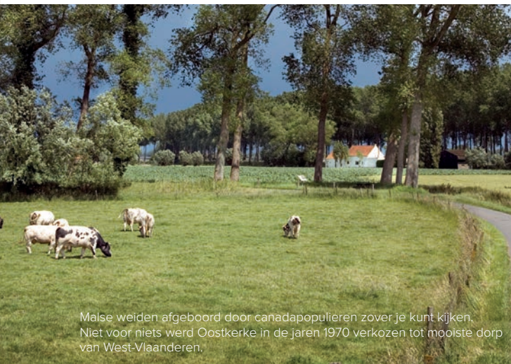
Malse weiden afgeboord door canadapopulieren zover je kunt kijken. Niet voor niets werd Oostkerke in de jaren 1970 verkozen tot mooiste dorp van West-Vlaanderen.