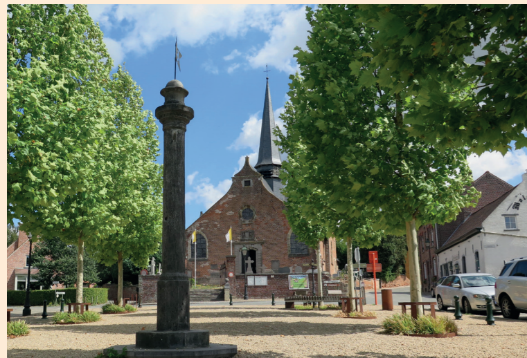
Ook het dorp Gaasbeek, met zijn O.L.V.-kerk, zijn dorpspleintje met schandpaal en zijn beschermde pastorie, loont de moeite.

Dit kaartje past perfect in een knooppunter-toestel.