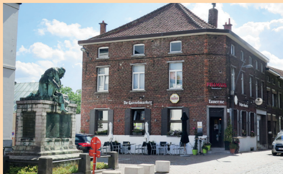
In het centrum van Sint-Pieters-Leeuw kun je pauzeren in Taverne De Gareelmaker.