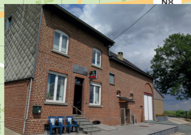
Midden het Brabantse kouterland kun je even op adem komen in de Kareeloven (Schepdaal).