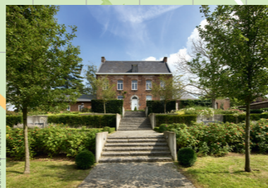
In Gaasbeek zijn zowel de oude pastorie als de pastorietaun als dorpszicht beschermd.