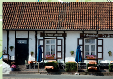
Het dorp van Sint-Anna-Pede, met herberg De Ster, lijkt sinds Breugels tijd amper veranderd.