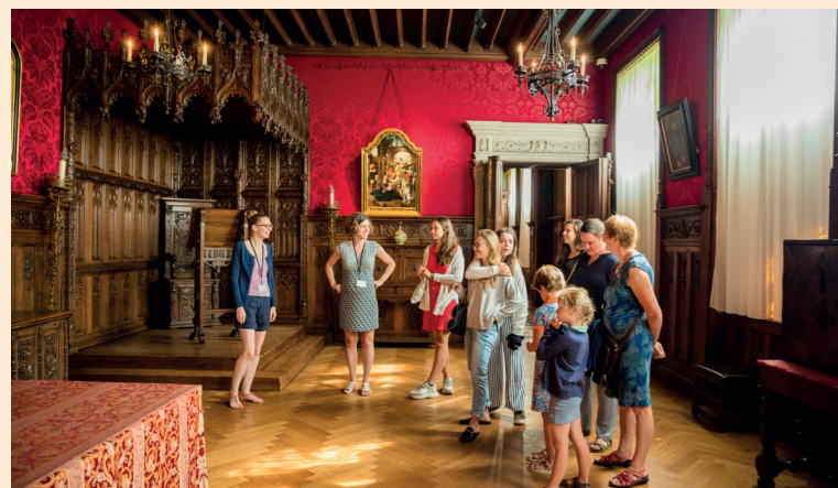
Het kasteel van Gaasbeek bulkt van de kunstschaten.

Om het hertogdom Brabant te beschermen tegen vijandelijke troepen uit Vlaanderen en Henegouwen liet Godfried van Leuven halfweg de 13de eeuw in Gaasbeek een waterburcht bouwen. Het zogeheten Land van Gaasbeek omvatte toen liefst zeventien dorpen. Vandaag is Gaasbeek een typisch Pajots plekje: zeer landelijk, met amper 300 inwoners. Het kasteel trekt er alle aandacht naar zich toe, maar vergeet toch ook niet oog te hebben voor het met bomen omzoomde dorpsplein. Er staat, precies in het midden, nog een authentieke schandpaal. Bij dat fotogenieke plaatje hoort evenzeer de hooggelegen Onze-Lieve-Vrouwkerk (1382). Ietwat verborgen achter die kerk is er de statige, beschermde pastorie (1758) met een boomgaard en een tuin in vier niveaus – beide vrij toegankelijk. Er staat een levensgroot beeld van een pastoor, al zijn het tegenwoordig wel platte-landsorganisaties die er onderdak vinden.