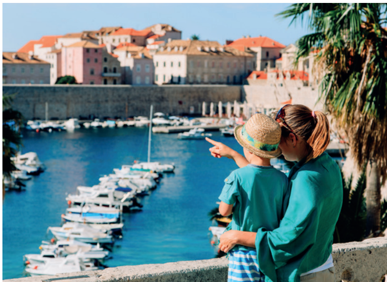
Kroatië is een populaire reisbestemming voor gezinnen.