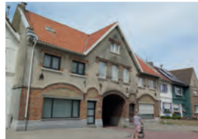
Het tuindorp of 'de cité', Zwankendamme