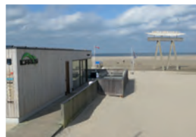
Surfclub Icarus op de zeedijk in Zeebrugge