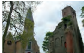
Dudzele, de Sint-Pietersbandenkerk: met twee torens