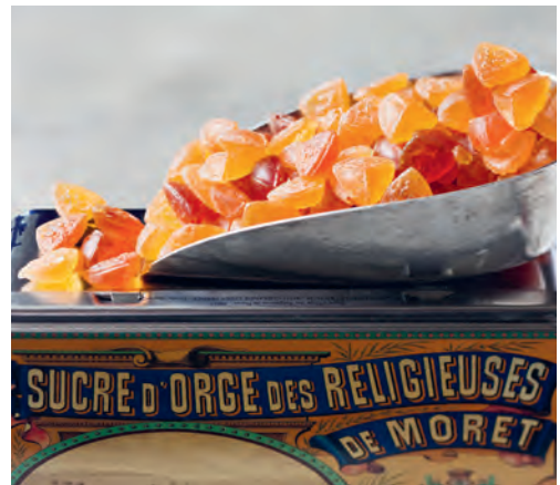
Gerstesuiker van Moret-sur-Loing

Moret-sur-Loing: ☒ Le Refuge. Open de deur van dit kleine etablissement en u zult beslist niet teleurgesteld zijn! De gerechten