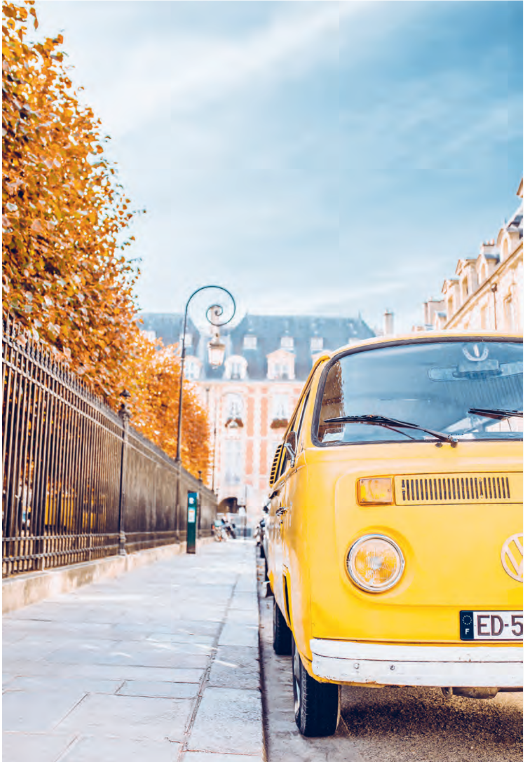
Place des Vosges, Paris