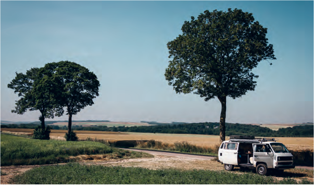
Even pauzeren op het platteland

14.00-18.00 u; park april-okt.: za., zon- en feestd. 14.00-18.00 u - € 9,50 (-13 jaar gratis) - enkel park: € 7,50 (kinderen € 5,50). Tearoom: april-okt.: za., zon- en feestd. 14.00-18.30 u.