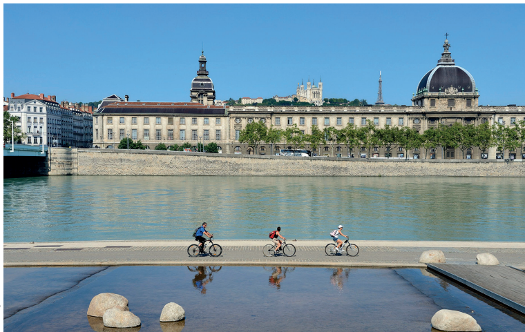
De oevers van de Rhône zijn ideaal voor een fietstocht.