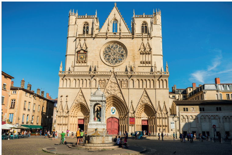
De gotische kathedraal Saint-Jean-Baptiste-et-Saint-Étienne vormt het hart van het oude Lyon.

De rozetten van het transept en het grote roosvenster in de gevel bevatten gotische glasramen. In de linkerkruisbeuk bevindt zich een 14de-eeuws astronomisch uurwerk ★ In 2013 werd het door vandalen beschadigd en sindsdien is het buiten gebruik.