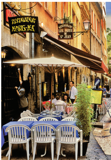
Unieke gerechten bij de Vietnamees Hong-Ha

Deze food court huist in de Tour Rose en is uniek in zijn soort. Hij richt zich