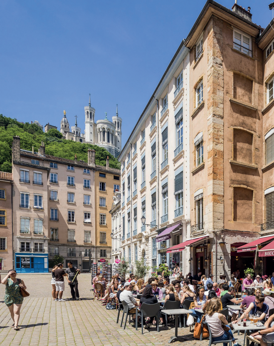
Uitnodigende terrassen op de place Saint-Jean met in de hoogte de basiliek van Fourvière