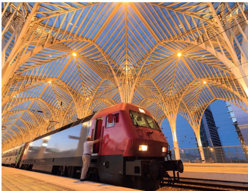
Het futuristische Estação do Oriente in Lissabon