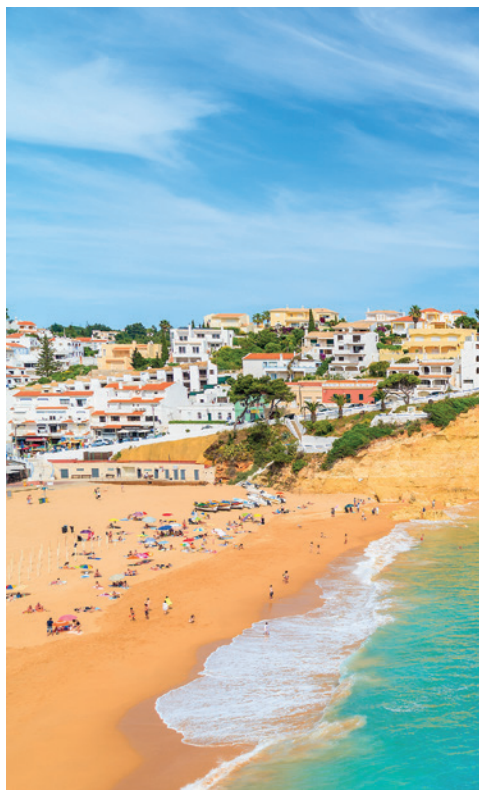
Praia de Carvoeiro in de Algarve

Tijd voor een tripje naar Portugal met zijn rijke cultuurerfgoed en zijn milde oceaan klimaat.