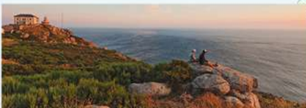
2 Cabo de Finisterre Zeelui vrezden de kaap vanwege de kliffen, maar als uitkijkpunt is ze uitstekend geschikt.