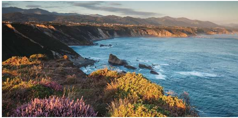
De wilde Costa Verde met haar gekloofde rotsen staat op het programma...

Beide trajecten bieden een overvloed aan kunst en cultuur en een geschiedenis die tot 1500 jaar teruggaat. Zowel kleinodden in dorpskerkjes als weelderige schatkamers in kathedralen liggen op uw weg.