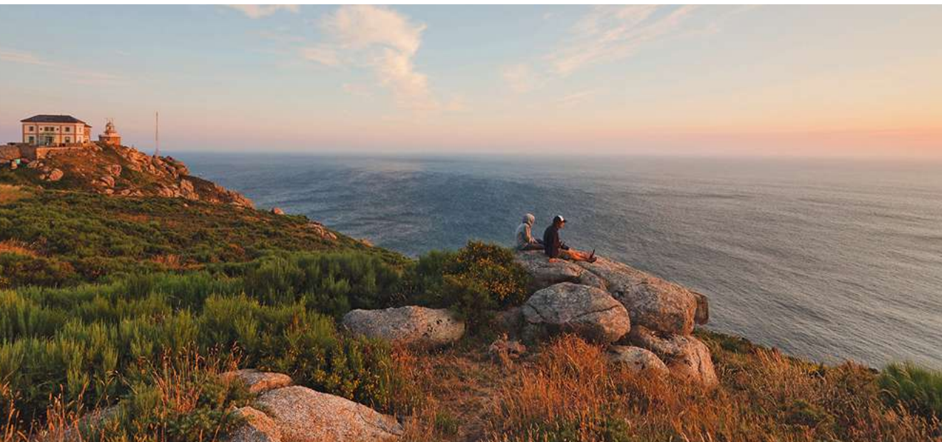
Een schilderachtige zonsondergang hult de Cabo de Finisterre in adembenemende kleuren.

In Galicië stuit u voortdurend op pelgrims die op weg zijn naar Santiago de Compostela. Wie echter op zoek is naar eenzaamheid en rust, vindt die overal aan de ruige kusten en in de vele kleine, zeer authentieke dorpen.