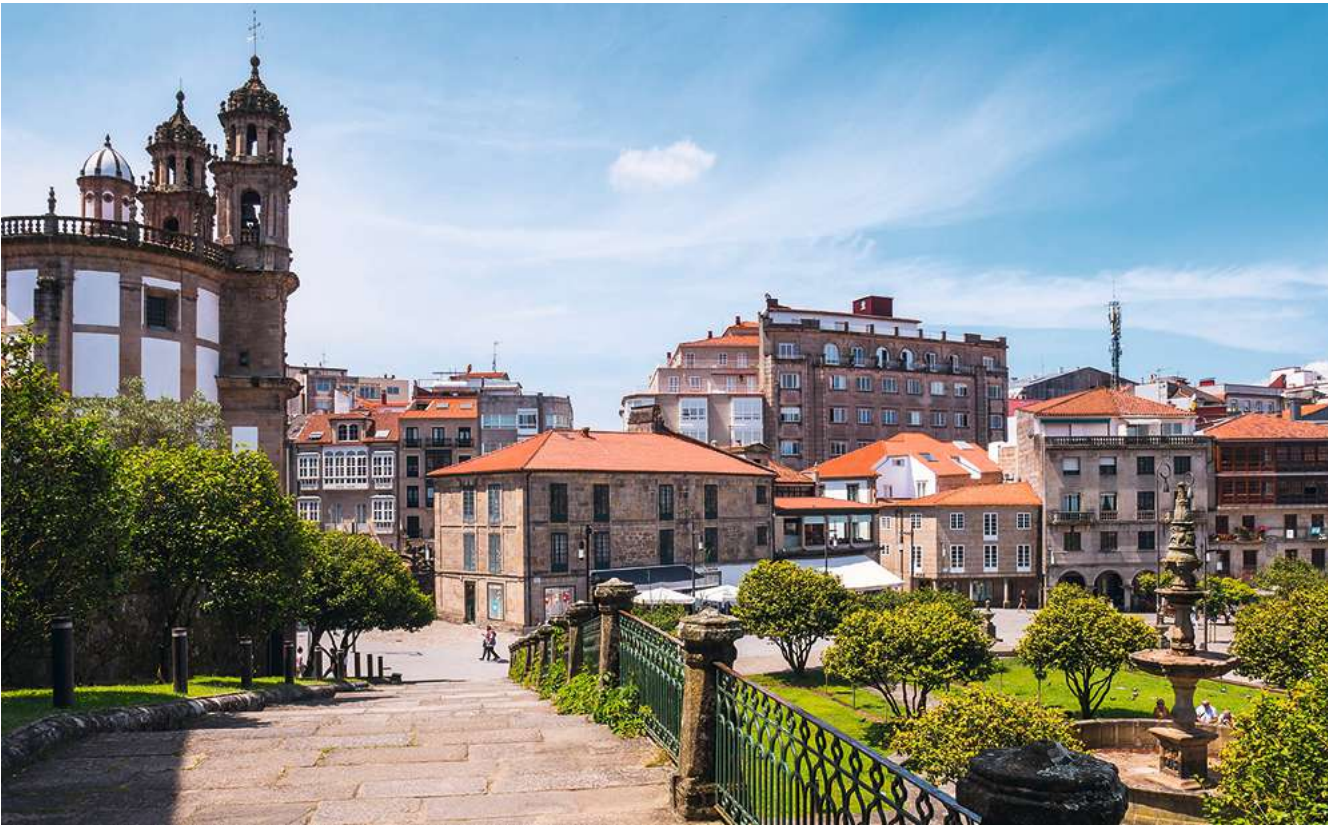
De Iglesia de la Peregrina en de Praza da Ferraría (op de foto rechts) in de oude binnenstad van Pontevedra