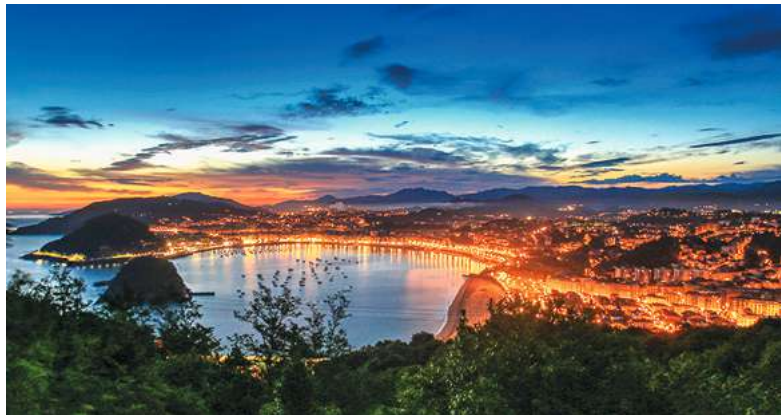
... net als de mooie havenstad San Sebastián.