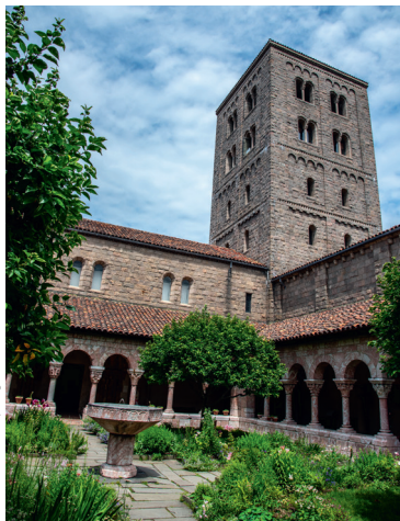
De middeleeuwse tuin van The Cloisters

♥ Haal diep adem in Riverside Park. Geniet in dit park van de prachtige natuur en van de mooie uitzichten op de rivier Hudson. U kunt er wandelen, fietsen of joggen. Bezoek er meteen de farmer's markets en daarna het