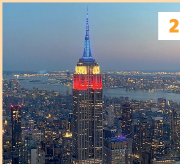
Empire State Building ★★★ Vouwkaart C5 - ④ blz. 71