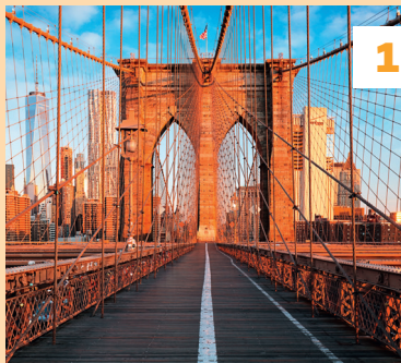
Brooklyn Bridge ★★★ Vouwkaart B8 - ④ blz. 40