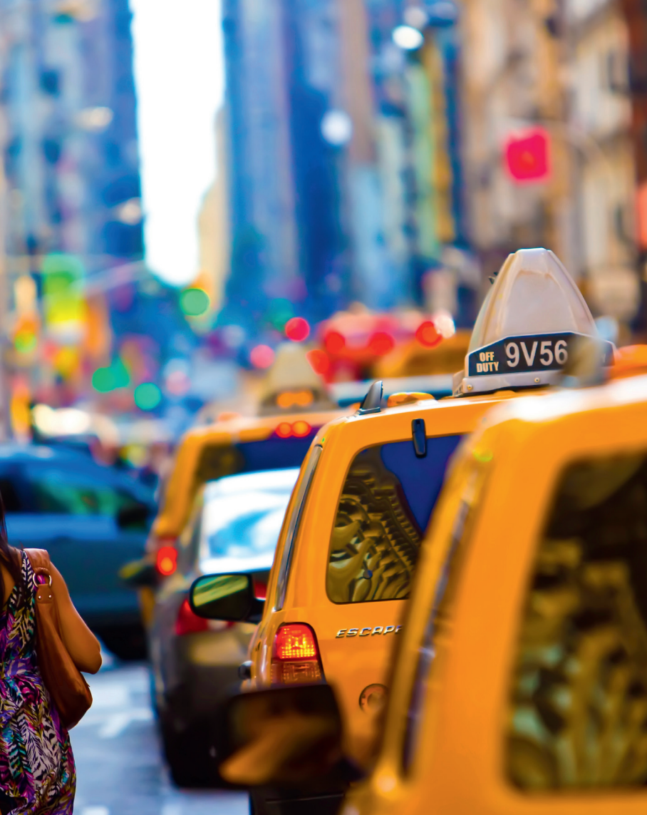
De gele taxi's, hier in Manhattan, zijn een symbool van New York.