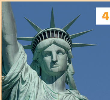
Statue of Liberty ★★★ Vouwkaart A8 - ④ blz. 36