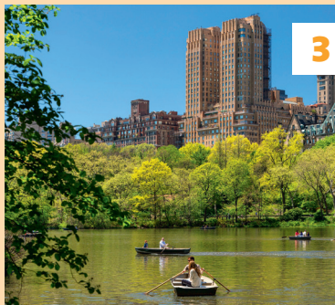
Central Park ★★★ Vouwkaart D-E2-3, C-D4 - ④ blz. 83