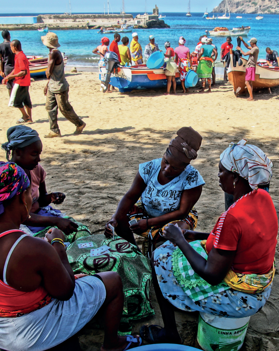
Het strand van Tarragal (Santiago) bij de terugkeer van de vissers