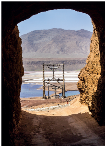
De zoutpannen bij Pedra de Lume

die door kabels werden voortgetrokken. De houten constructies die het systeem ondersteunden, doen een beetje denken aan de bekende brug over de rivier Kwai. U mag hier baden ( het is aanbevolen nadien te douchen - 100 CVE ), vergelijk het met een duik in de Dode Zee. Door het hoge zoutgehalte kunt u bijna op het water gaan zitten. In het kleine